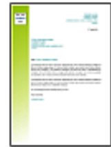
Lettre commerciale moderne serif