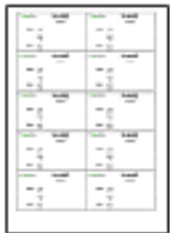
Carte de visite avec logo