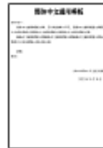
Chinois simplifié normal