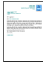
Lettre commerciale moderne sans-serif